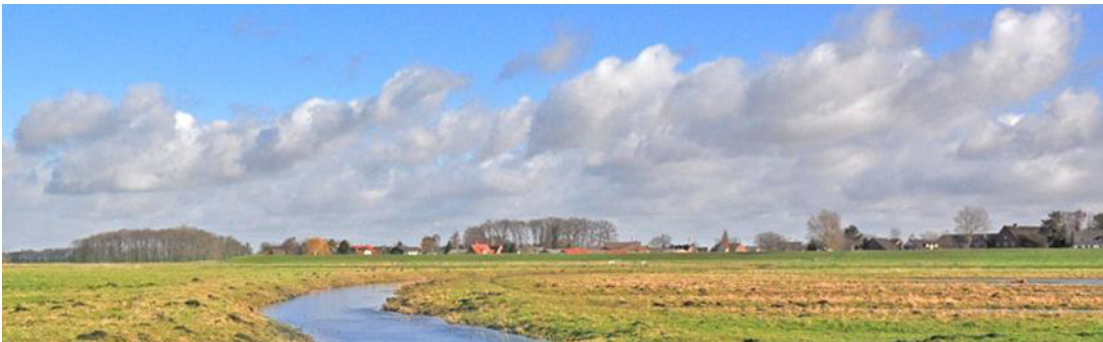
Hetlingen - die idyllische Elbmarschengemeinde im Hamburger Umland