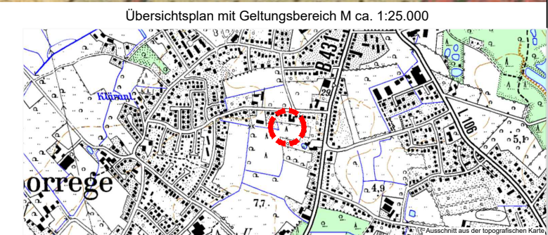
Übersichtsplan mit Geltungsbereich M ca. 1:25.000