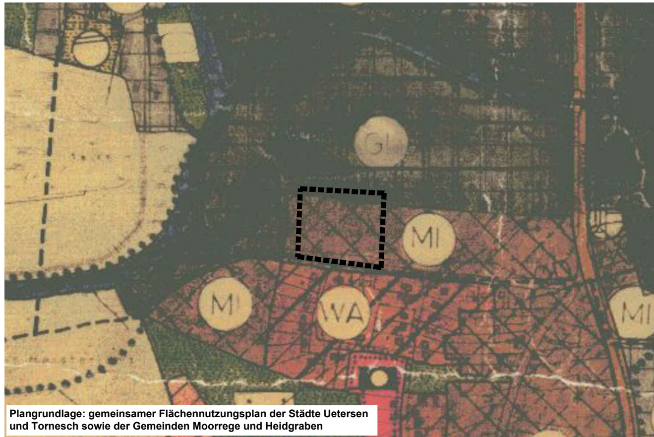
Darstellung des wirksamen Flächennutzungsplanes