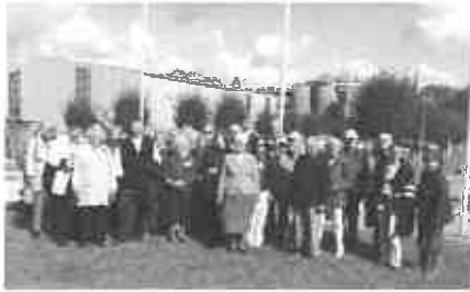
Besuch beim Abwasserzweckverband in Hetlingen

Wieder wehten die britische und die Appener Flagge am Bürgerhaus in Appen.